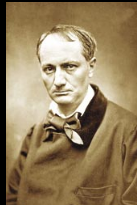
Charles Baudelaire por Etienne Carjat.

Hoy por hoy, cientos de expedientes científicos avalan la reencarnación, no sólo de figuras conocidas o de personalidades literarias. A través de regresiones hipnóticas